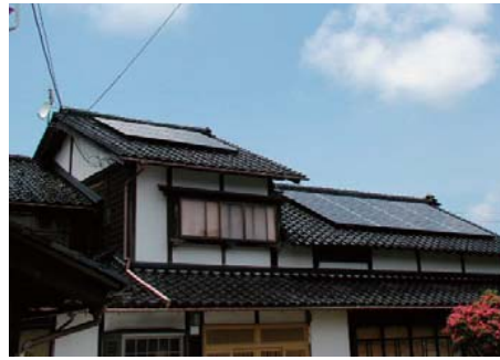
Panasonic Hit230 22 枚設置 太陽光発電容量 5.06kw

太陽光発電をご検討の方はお気軽にご相談下さい！ 更に詳しいデータをご用意してお待ちしております。