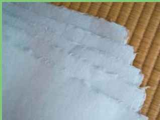
手作り感が美しい。