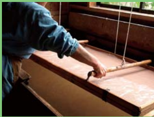
一枚一枚手漉きです。

早いものでもう師走。年の瀬も近づいてきました。年末恒例の大掃除をして、新しい年を迎えたいもの。お手軽に能登の素材を取り入れられると言えば、「和紙」輪島三井にて手漉き和紙を制作されている「能登仁行和紙」を障子の張り替えに使ってみませんか？ シンプルな「楮（こうぞ）紙」の他に、様々な植物を漉き込んだ和紙があります。リファインなおショールームにてサンプルをご用意しておりますので、是非ご覧下さい！